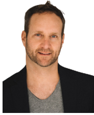
Matthias Strolz Impact-Unternehmer Autor und Publizist, Begleiter in Wachstumsprozessen